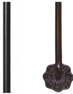
Balustre acier à la française