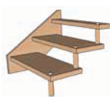
Escaliers sur entretoises