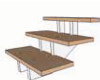
Double crémaillères centrales. Gamme Équilibre

Réf. : LC - gamme Atmosphère (option fixation invisible)