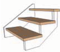
Crémaillère à l'anglaise