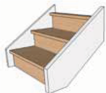
Limon à la française