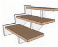
Limon gamme Apesanteur