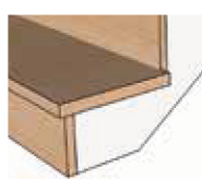
options contremarches (escaliers sur crémaillères)